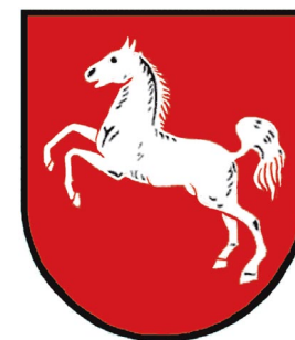
Niedersächsisches Ministerium für Inneres, Sport und Integration

Wegweiser zum Miteinander im Kleingärtnerverein Wir sind Gartenfreunde!