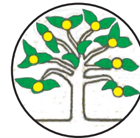
Landesverband der Gartenfreunde Ostfriesland e. V.